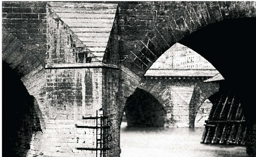
Pont Notre dame, 1865

A l'inverse de la peinture mettant en œuvre une logique organique de totalisation immanente à cause de son caractère construit et pensé, à cause du fait que le peintre invente librement son espace et sa lumière, la photographie se donne toujours comme un fragment du réel découpé plus ou moins fortuitement dans un espace donné et matériellement contraint. 17 L'opération photographique majeure est donc toujours celle d'une coupe et d'un prélèvement. Cette coupe, est spatiale et temporelle. Elle ouvre nécessairement l'image sur ce qu'elle ne montre pas ; ce qui est à côté (hors-champ), ce qui est avant ou ce qui est après, alors que la peinture semble naturellement se clore sur elle-même pour se constituer comme un monde :