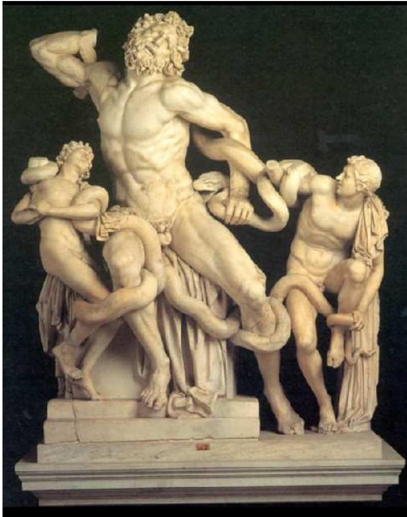
Laocöon, sculpture grecque antique, musée Pio-Clementino (Vatican)

« Avec la beauté nous pénétrons dans le monde des Idées, sans que toutefois nous quittions le monde des sens, ainsi qu'il arrive lorsque nous connaissons la vérité. » ( Lettres sur l'éducation esthétique de l'homme , Aubier, p. 311)