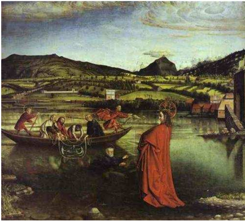
Konrad Witz, Pêche miraculeuse , 1444