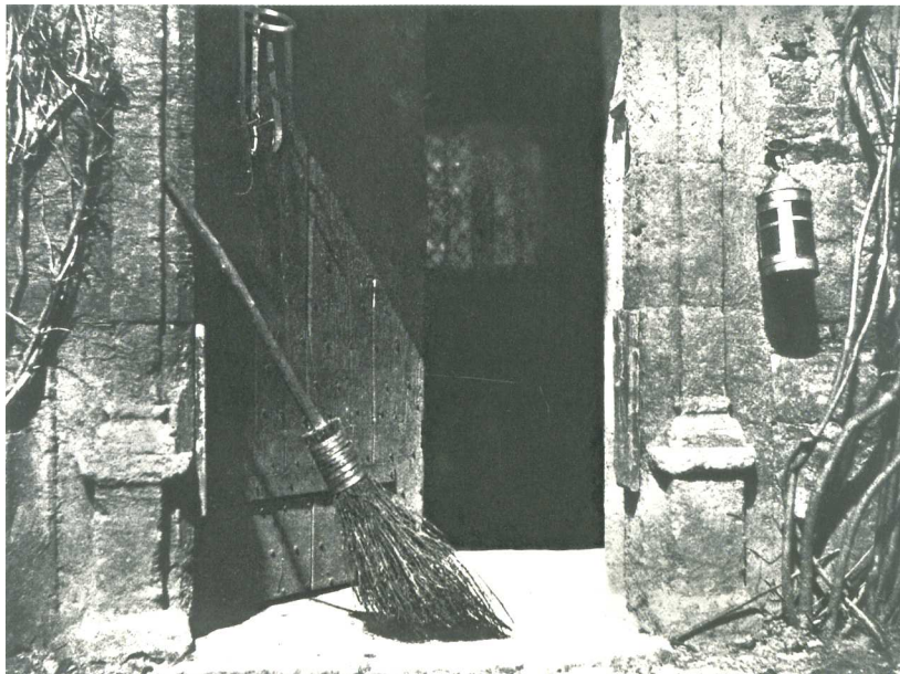
William Fox Talbot, La porte ouverte , planche VI Crayon de la nature (1844-1846)

« Ne pas aimer la peinture, c'est mépriser la vérité même, c'est mépriser ce genre de vérité que nous rencontrons chez les poètes [...], c'est aussi n'avoir point d'estime pour la science des proportions, par laquelle l'art se rattache à l'usage même de la raison. » (Les Belles Lettres, 1991, Prologue, p. 9)