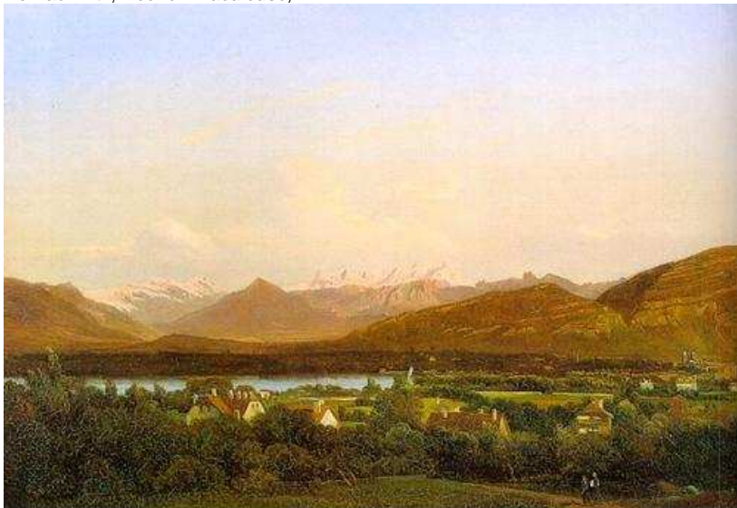
Alexandre Calame, Le lac léman , 1850