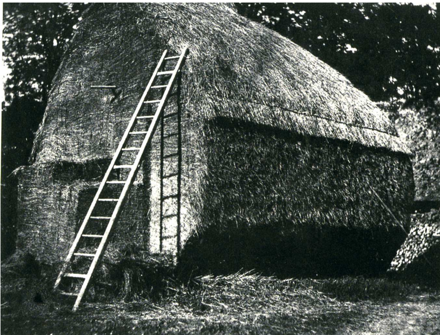
William Fox Talbot, Meule , planche X du Crayon de la nature (1844-1846)

Le propos de mon intervention est de réfléchir sur la beauté photographique c'est-à-dire sur la nature et le statut de cette beauté que l'un des premiers inventeurs de la photographie – l'anglais William Henry Fox Talbot – appela en 1839 « photogénique ». Engendrée par la lumière au moyen d'une