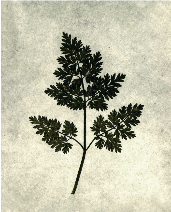
W F Talbot, Feuillage , planche VII du Crayon de la nature

L'image-machine de la photographie relève « d'une visibilité qui fait l'économie de la vision » ou d'une « vision en l'absence d'œil. » Derrière les intentions du photographe, elle s'adosse à une vision objective et abstraite (au sens de séparée) qui montre le monde comme étranger et à distance. La terre photographiée étant alors vue comme un astre au télescope, la photographie réalise comme un décentrement qui fait que toute photographie est par essence une photographie de lune rendant étranger ce qui nous est le plus familier. Ceci est valable pour la photographie des êtres les plus proches que nous aimons et évidemment pour celle de nous-même ; ceci est d'autant plus valable (et apparaît avec la plus grande force) quand ce qui est montré est un monde désertique, sauvage, bouleversé, dévasté, cristallin, primitif comme celui de la montagne. Hegel disait devant van Eyck ou Vermeer que la peinture représentait les choses comme « tirées de l'intérieur ». La photographie désormais nous montre un monde d'objets purs : son automaticité et son impersonnalité tuent le travail manuel de l'artiste ainsi que son travail mental de composition, d'interprétation, d'idéalisation ou de spiritualisation. Sa rapidité détourne les hommes de la voie de la rêverie et de l'imagination ; elle les amène ainsi « dans la voie du progrès », selon l'expression ironique de Baudelaire dans le salon de 1859 .