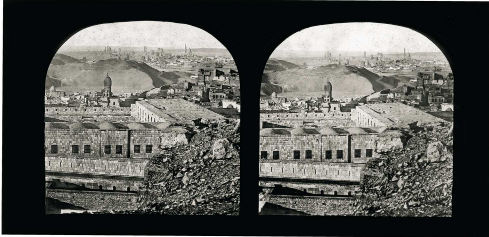
Francis Frith, Vue du Caire , 1857

Comme le cliché n'est pas un microcosme « achevé ou accompli en soi », il peut ainsi pénétrer la trame même du donné, et, « au cœur du réel » 19 , faire émerger le fourmillement et l'égalité remarquables des détails que le photographe ne choisit pas. Tout se voit. Sans la sélection en quoi consiste l'art du peintre, la photographie étale sous les yeux du spectateur le spectacle inédit vers 1850 d'une image où, du bord au centre, rien n'est sacrifié ni rejeté. Ce que même la perception ordinaire vivante ne peut pas voir parce qu'elle hiérarchise le donné sensible à l'aune des intérêts de la vie courante, la photographie le livre tel quel dans une démesure et une indifférence qui ont effrayé Baudelaire, Delacroix et beaucoup de leurs contemporains parce qu'ils y voyaient la négation de l'art et le débordement de l'humain. Écoutons Delacroix en 1859 la même année que le célèbre texte de Baudelaire « Le public moderne et la photographie » :