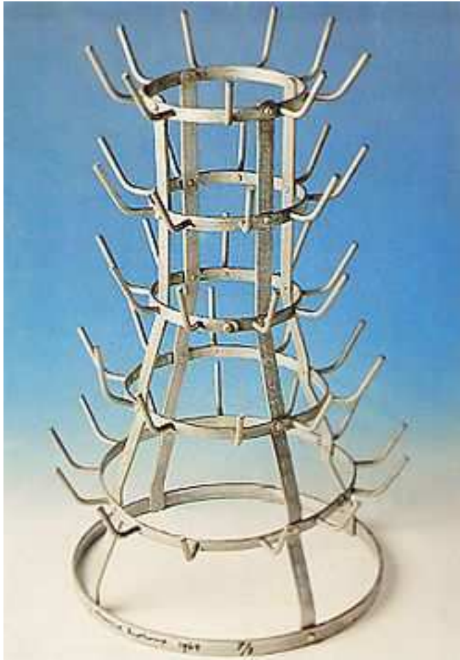
Marcel Duchamp, Porte bouteille , vers 1915

Ces œuvres venues de la déliaison de l'art et du savoir-faire, elles répondent toutes positivement (et chacune à leur façon ouverte) à la question ironique que posait Marcel Duchamp en 1913 : « Peut-on faire des œuvres qui ne soient pas "d'art ?" » 30 Car on peut considérer après d'autres 31 , que Duchamp, l'ami de Man Ray et influencé selon ses dires par les travaux d'Etienne-Jules Marey, prit entièrement acte des bouleversements qu'opéra la photographie dans le domaine de l'art au point de penser ce dernier comme de nature foncièrement photographique. La photographie engendra, alors et avec lui, le photographique . 32 Comment ? Rosalind Krauss répond très clairement : par l'exigence d'abaissement de l'art dans les triviales régions de l' ordinaire ;